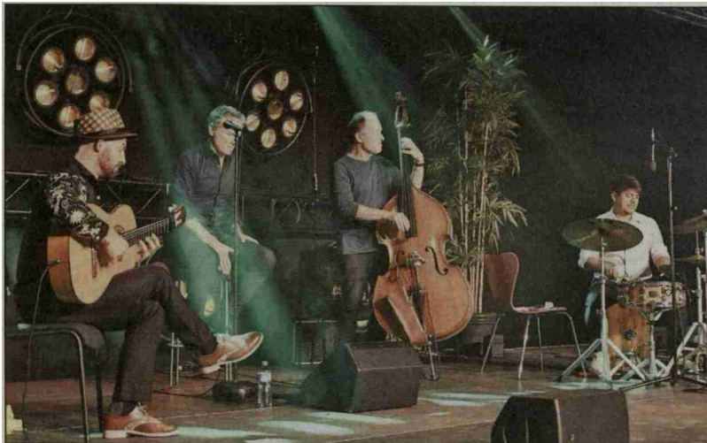
Unterhaltung durch «MatterLive» und...

Referenz: 75407023 Ausschnitt Seite: 2/2